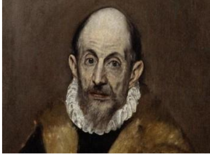
«Πορτραίτο άνδρα», θεωρούμενο ως αυτοπροσωπογραφία του Δομήνικου Θεοτοκόπουλου

Ο Δομίνικος Θεοτοκόπουλος γεννήθηκε στην Κρήτη το 1541, αλλά έζησε τα περισσότερα χρόνια της ζωής του στην Ισπανία, και συγκεκριμένα στο Τολέδο. Εκεί έγινε γνωστός με το όνομα Ελ Γκρέκο ( el Greco- ο Έλληνας). Ταξίδεψε στη Βενετία, όπου μαθήτευσε στα εργαστήρια των ζωγράφων Μπασάνο, Τιτσιάνο και Τιντορέντο, γνωστών ζωγράφων της Αναγέννησης. Πέθανε στα 1614, αφήνοντας μας πολύ σπουδαία έργα που επηρέασαν ακόμα και ζωγράφους της μοντέρνας τέχνης όπως τον Πικάσο.