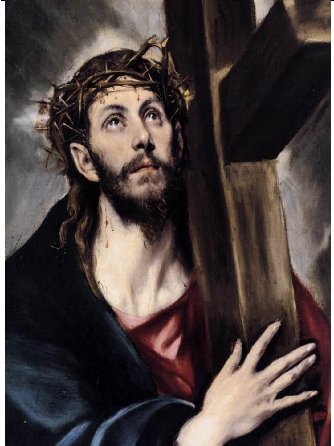
Ο Χριστός μεταφέρει τον Σταυρό, 1570