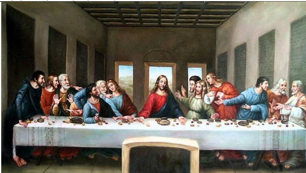
Ο μυστικός δείπνος, 1495

Ας τον συγκρίνουμε τώρα με το μυστικό δείπνο του Ντα Βίντσι: