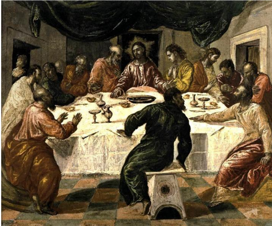
Ο Μυστικός Δείπνος, 1568

Θα σταθούμε περισσότερο όμως στον πίνακά του: